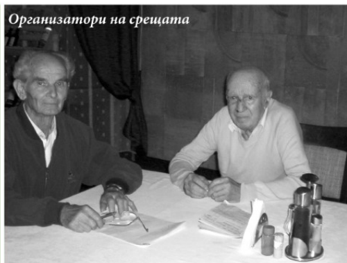
Организатори на срещата

Двамата не сдържаха сълзите си от емоционалната